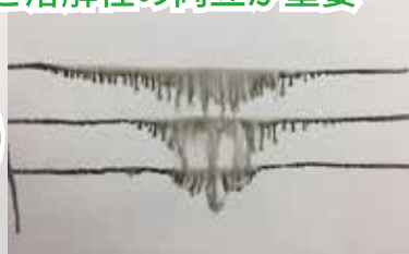
ゴーストを消すときのインク溶解性