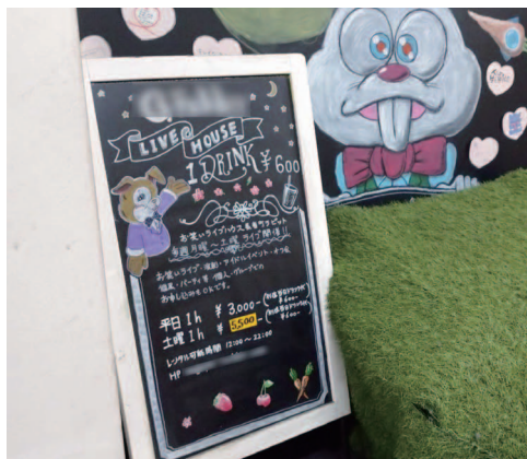
イベントスペース