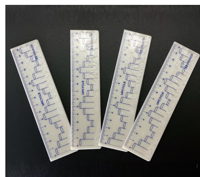
シルクスクリーン

ハンドメイドのため、作品の仕上がりには個体差があります。写真と実際の品が、若干異なる場合もございます。 ハンドメイド特有の「表情」としてお楽しみください。 本製品は、水に濡れると変色や変形の恐れがあります。なるべく水に濡らさないようご配慮をお願いします。