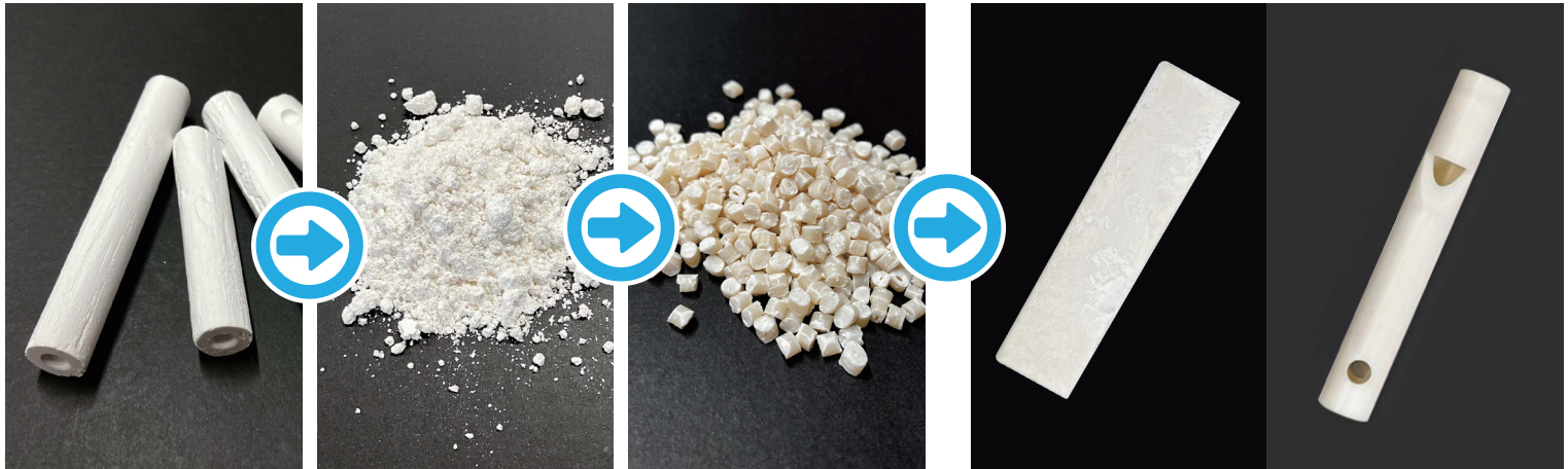
製造不良による廃棄チョーク

チョークで創業した馬印。 しかしチョークの製造不良で廃棄がでる事に苦慮してました。 そんな時、樹脂に廃棄チョークを混ぜたらと思いつきます。 試作をしたら、風合いはよいのですが、折れやすくなりました。 そこから配合比率を何回もテストしてようやくカタチになりました。