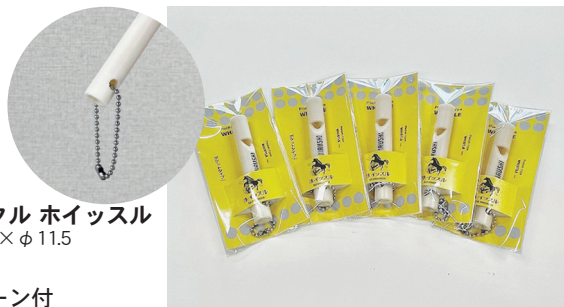
アップサイクル ホイッスル 外形寸法 / 80×φ11.5 質 量 / 7g ボールチェーン付